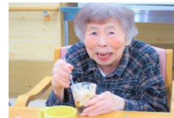
▲秋…栗の入った和風パフェ