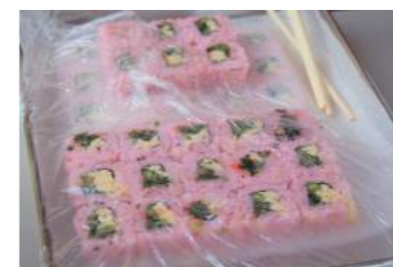
▲夏…納涼祭では外の屋台で巻き寿司や焼き鳥、今川焼など家族や職員と一緒に