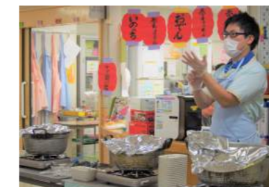
▲冬…出張おでん屋台 店長はフロアの見知った職員です。