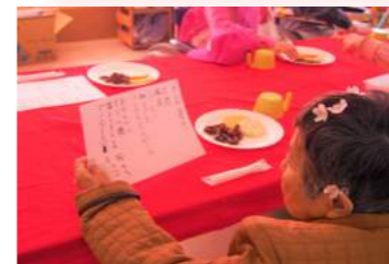
▲春…花見の後のティタイム