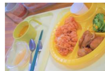
▲クリスマスには器も変えて