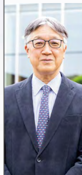
特定医療法人 丸山会