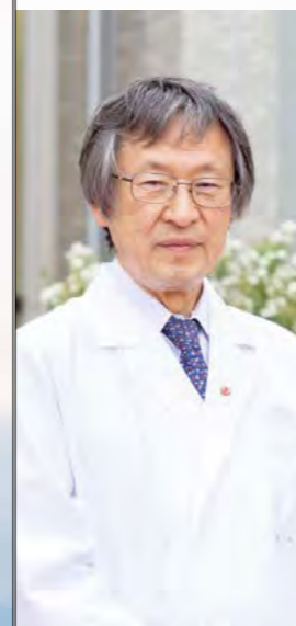
特定医療法人 丸山会 丸子中央病院

丸山医院開業から60年が経過し、超高齢化など社会構造の大きな変化によって地域や医療の在り方が大きく変わりました。その変化に対応するために平成25年8月、上田市丸中丸子に新築移転しました。同時に新病院の名称を「丸子中央病院」に戻し、開業当時の原点に立ち返り地域に根ざした病院を目標に再スタートしました。療養環境も大事な治療と考え廊下と病室はゆとりあるスペースを確保し、大きな窓を配置した病棟の食堂からは浅間